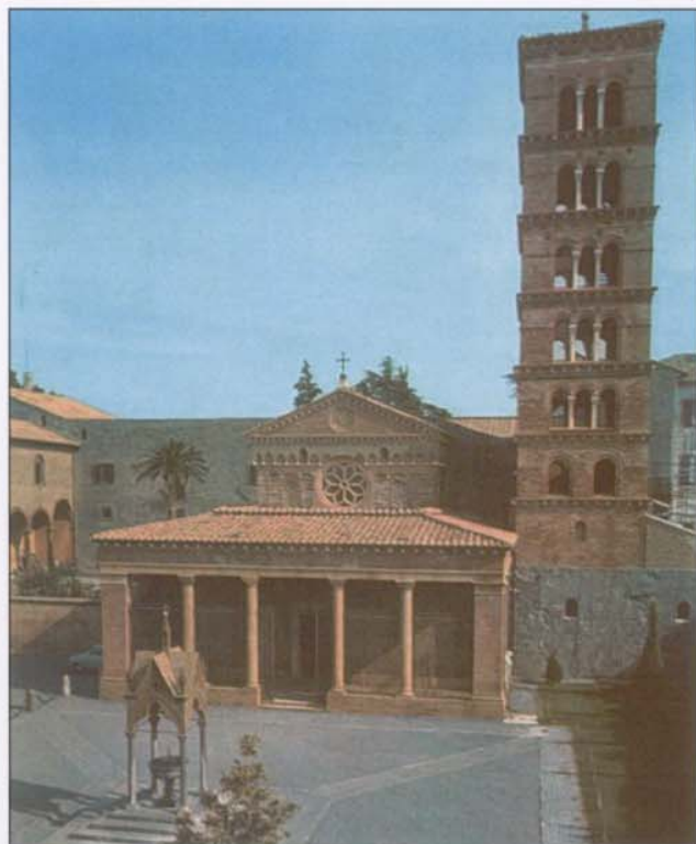
Grottaferrata. Abbazia di San Nilo

Infine Casamari, in Ciociaria, è uno degli esempi maggiormente conservati dell'architettura gotica in Italia. Fondata dai monaci Benedettini nel 1036 fu in seguito assegnata da papa Innocenzo II, nel 1140, ai Cistercensi provenienti dalla Francia al seguito di Bernardo di Clervaux.