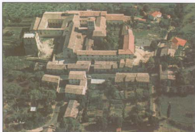
Fara Sabina. Abbazia di Farfa.

Uno dei punti di forza della parte di progetto attuata dalla Direzione Cultura si fonda sul respiro europeo di tali ordini monastici che hanno rappresentato, fin dal Medioevo, l'interscambio in Europa di esperienze culturalmente diverse, ma unite nel comune spirito dell'ospitalità e nel fondamentale ruolo di trasmissione della cultura.