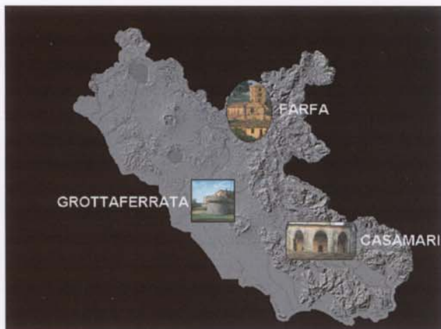
Ubicazione dei tre monasteri nel Lazio.

La proposta di un progetto inerente i monasteri, promossa dalla Development Company of Prefecture of Magnesia (ANEM), quindi da un paese come la Grecia che vanta in quest'ambito una tradizione plurisecolare, non poteva che trovare l'immediato interesse della Regione Lazio così storicamente e territorialmente legata alla vita della Chiesa cattolica. Il progetto ha rappresentato un'opportunità importante per la valorizzazione di un patrimonio culturale, architettonico e spirituale per cui il Lazio ha potuto vantare un primato europeo, ma anche per la promozione turistica del territorio e delle sue ricchezze.